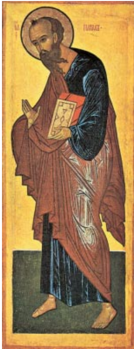
Sant Pau. Icona del s. xv. Museu rus. Sant Petersburg

Y la Palabra se hizo carne y acampó entre nosotros, y hemos contemplado su gloria: gloria propia del Hijo único del Padre, lleno de gracia y de verdad. Juan da testimonio de él y grita diciendo: «Éste es de quien dije: "El que viene detrás de mí pasa delante de mí, porque existía antes que yo".» Pues de su plenitud todos hemos recibido, gracia tras gracia. Porque la Ley se dio por medio de Moisès, la gracia y la verdad vinieron por medio de Jesucristo. A Dios nadie lo ha visto jamás: Dios Hijo único, que está en el seno del Padre, es quien lo ha dado a conocer.