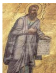
Mosaico del ábside de la Basílica de San Pablo Extramuros, Roma

I ncluso cuando su realización material representaba un sueño imposible, los judíos celebraban cada año la Pascua bajo el lema: «¡El año que viene, en Jerusalén!» Pablo habría ido muchas veces a Jerusalén en su juventud y nunca olvidó ese punto de referencia: fue a Jerusalén en cuanto le fue posible después de la experiencia de Damasco y volvió allí después de los conocidos como primero, segundo y tercer viaje.