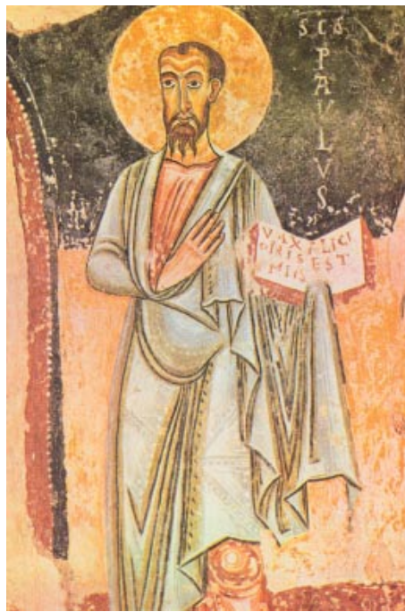
Sant Pau. Pintura mural del segle XII, procedent del Castell d'Orcau. MNAC, Barcelona

En aquel tiempo, Jesús y sus discípulos entraron en Cafarnaúm, y cuando el sábado siguiente fue a la sinagoga a enseñar, se quedaron asombrados de su doctrina, porque no enseñaba como los escribas, sino con autoridad. Estaba precisamente en la sinagoga un hombre que tenía un espíritu inmundo, y se puso a gritar: «¿Qué quieres de nosotros, Jesús Nazareno? ¿Has venido a acabar con nosotros? Sé quién eres: el Santo de Dios.» Jesús le increpó: «Cállate y sal de él.» El espíritu inmundo lo retorció y, dando un grito muy fuerte, salió. Todos se preguntaron estupefactos: «¿Qué es esto? Este enseñar con autoridad es nuevo. Hasta a los espíritus inmundos les manda y le obedecen». Su fama se extendió en seguida por todas partes, alcanzando la comarca entera de Galilea.