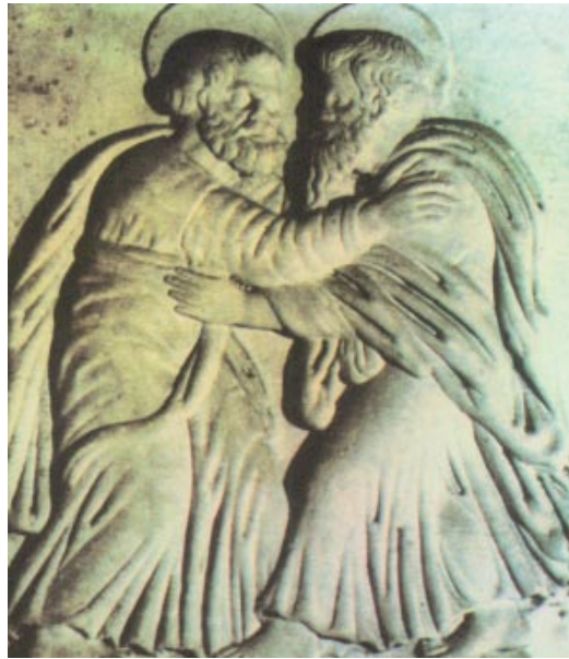
Pere i Pau s'abracen abans del martiri. s. xvi. Museu de la Via d'Òstia. Roma

Se levantó de madrugada, se marchó al descampado y allí se puso a orar. Simón y sus compañeros fueron y, al encontrarlo, le dijeron. «Todo el mundo te busca.» Él les respondió: «Vámonos a otra parte, a las aldeas cercanas, para predicar también allí; que para eso he salido.» Así recorrió toda Galilea, predicando en las sinagogas y expulsando los demonios.