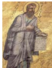
Mosaico del ábside de la Basílica de San Pablo Extramuros, Roma

Los romanos salvaron a Pablo de un linchamiento, pero no hubieran podido mantenerle por mucho tiempo en Jerusalén. Le mandaron a Cesarea Marítima, sede del gobernador romano, donde se le concedió cierta comodidad y la posibilidad de tener contacto con el mundo exterior. El Procurador Félix le mantuvo allí dos años, con la esperanza de sacar un rescate por él (sabía de los buenos contactos que tenía por el Mediterráneo y que había llegado al país cargado de dinero).