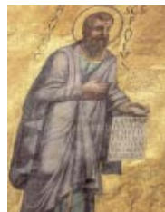
Mosaico del ábside de la Basílica de San Pablo Extramuros, Roma

El viatge de Cesarea a Roma fue una epopeya, contada (casi: «cantada») por Lucas en los últimos capítulos de los Hechos. En Roma se le concedió la situación más favorable: una casa alquilada, con un guardia a la puerta, donde Pablo podía recibir incluso