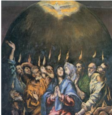
La vinguda de l'Esperit Sant. Pintura d'El Greco (fragment). Museu del Prado. Madrid

Gloria a Dios para siempre, / goce el Señor con sus obras. / Que le sea agradable mi poema, / y yo me alegraré con el Señor. R.