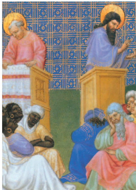
Sant Pere i Sant Pau prediquen un Evangeli dirigit a tots els homes. Gravet del Llibre d'Hores del duc de Berry. Museu Condé. Chantilly (França)

Llegaron de casa del jefe de la sinagoga para decirle: «Tu hija se ha muerto. ¿Para qué molestar más al maestro?» Jesús alcanzó a oír lo que hablaban y le dijo al jefe de la sinagoga: «No temas; basta que tengas fe.» No permitió que lo acompañara nadie, más que Pedro, Santiago y Juan, el hermano de Santiago. Llegaron a casa del jefe de la sinagoga y encontró el alboroto de los que lloraban y se lamentaban a gritos. Entró y les dijo: «¿Qué estrépito y qué lloros son éstos? La niña no está muerta, está dormida.» Se reían de él. Pero él los echó fuera a todos y, con el padre y la madre de la niña y sus acompañantes, entró donde estaba la niña, la cogió de la mano y dijo: «Talitha qumi» (que significa: «Contigo hablo, niña, levántate»). La niña se puso en pie inmediatamente y echó a andar; tenía doce años. Y se quedaron viendo visiones. Les insistió en que nadie se enterase; y les dijo que dieran de comer a la niña.