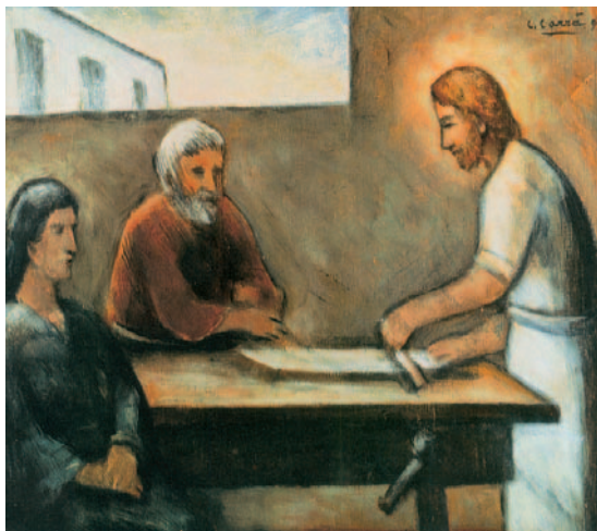
Jesús treballant en el seu taller, prop de Maria i Josep. Pintura de Carlo Carrà (any 1953). Museu sobre Jesucrist. Assís (Itàlia)

En aquel tiempo, fue Jesús a su pueblo en compañía de sus discípulos. Cuando llegó el sábado, empezó a enseñar en la sinagoga; la multitud que lo oía se preguntaba asombrada: «¿De dónde saca todo eso? ¿Qué sabiduría es ésa que le han enseñado? ¿Y esos milagros de sus manos? ¿No es éste el carpintero, el hijo de María, hermano de Santiago y José y Judas y Simón? Y sus hermanas ¿no viven con nosotros aquí?» Y esto les resultaba escandaloso. Jesús les decía: «No desprecian a un profeta más que en su tierra, entre sus parientes y en su casa.» No pudo hacer allí ningún milagro, sólo curó algunos enfermos imponiéndoles las manos. Y se extrañó de su falta de fe. Y recorría los pueblos de alrededor enseñando.