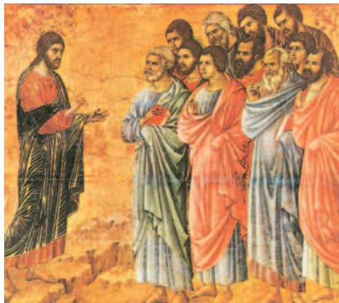
Jesús i els apòstols. Pintura de Duccio di Buoninsegna (s. XIV). Museu de la catedral de Siena (Itàlia)

Oh, sí! La vostra bondat i el vostre amor / m'acompanyen tota la vida, / i viuré anys i més anys / a la casa del Senyor. R.