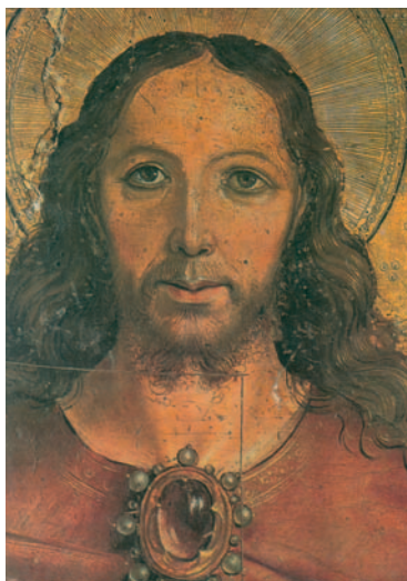
Faç de Jesús. Pintura atribuïda a Pedro Berruguete. Museu Diocesà de Palència

Porque el pan de Dios es el que baja del cielo y da vida al mundo.» Entonces le dijeron: «Señor, danos siempre de este pan.» Jesús les contestó: «Yo soy el pan de vida. El que viene a mí no pasará hambre, y el que cree en mí nunca pasará sed.»