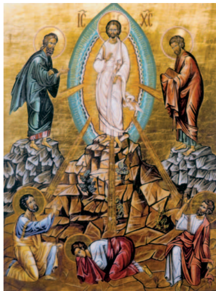
El proper dijous s'escau, en ple estiu, una festa del Senyor molt significativa: la seva transfiguració dalt d'una muntanya amb els seus tres deixebles més amics. En un ambient de fe i de pregària, Jesús es transfigura davant d'ells mentre parla de la seva mort propera. Jesús els vol fer entendre que allò és com un tast del que serà el final del seu camí. Els vol fer entendre que el seu camí porta a la mort, però que aquella mort obrirà les portes a la vida plena i lluminosa de la resurrecció. Una festa pasqual, doncs. Com serà una festa pasqual, aplicada a Maria, la del proper 15 d'agost. Molts dels qui porten el nom de Salvador celebren avui el seu sant. Altres ho celebren el 18 de març, festa d'un franciscà català, sant Salvador d'Horta. Gravat: La Transfiguració. Monestir de Benedictines de la Nativitat (Madrid).

A quella conversa de mare i fill és versemblant. Però seria desitjable que evitéssim expressions com «no està bé» o «això no es fa», com donant a entendre que «no està ben vist»: podria ser que la majoria ho fes i ho veiés bé... En canvi, amb majoria o sense, el que no podem és renunciar a l'amor ressuscitat com a font absoluta de veritat i de sentit de tots els nostres afectes. No exigim la seva perfecció, però sí, al menys, voler fer camí.