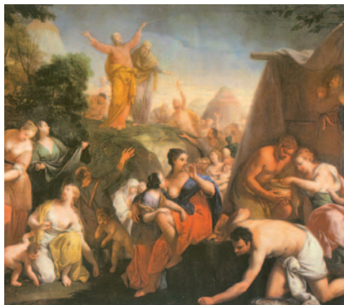
La recollida del manà. Pintura de Lazarini. Museu de l'Acadèmia (Venècia)

Acampa l'àngel del Senyor / entorn dels seus fidels, per protegir-los. / Tasteu i veureu que n'és de bo el Senyor; / feliç l'home que s'hi refugia. R.