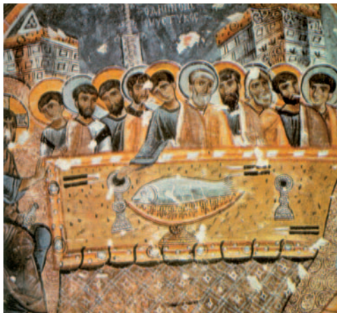
La Santa Cena. Fresc de Goreme (Turquia)

Mi carne es verdadera comida, y mi sangre es verdadera bebida. El que come mi carne y bebe mi sangre habita en mí y yo en él. El Padre que vive me ha enviado, y yo vivo por el Padre; del mismo modo, el que me come vivirá por mí. Éste es el pan que ha bajado del cielo: no como el de vuestros padres, que lo comieron y murieron; el que come este pan vivirá para siempre.»