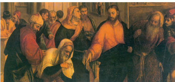
Jesús és observat per un grup de fariseus. Pintura de P. de Pitati (fragment). Galeria Brera, Milà (Itàlia)

El que no presta dinero a usura / ni acepta soborno contra el inocente / El que así obra nunca fallará. R.