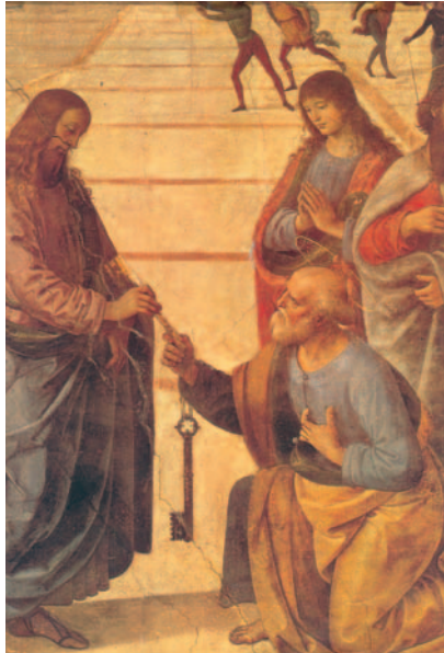
Jesús lliura les claus del Regne a St. Pere, pintura del Perugino. Capella Sixtina. Ciutat del Vaticà

En aquel tiempo, Jesús y sus discípulos se dirigieron a las aldeas de Cesarea de Felipe; por el camino, preguntó a sus discípulos: «¿Quién dice la gente que soy yo?». Ellos le contestaron: «Unos, Juan Bautista; otros, Elías; y otros, uno de los profetas». Él les preguntó: «Y vosotros, ¿quién decís que soy?». Pedro le contestó: «Tú eres el Mesías». Él les prohibió terminantemente decirselo a nadie. Y empezó a instruirlos: «El Hijo del hombre tiene que padecer mucho, tiene que ser condenado por los ancianos, sumos sacerdotes y escribas, ser ejecutado y resucitar a los tres días». Se lo explicaba con toda claridad. Entonces Pedro se lo llevó aparte y se puso a increparlo. Jesús se volvió y, de cara a los discípulos, increpó a Pedro: «¡Quítate de mi vista, Satanás! ¡Tú piensas como los hombres, no como Dios!» Después llamó a la gente y a sus discípulos, y les dijo: «El que quiera venirse conmigo, que se niegue a sí mismo, que cargue con su cruz y me siga. Mirad, el que quiera salvar su vida la perderá; pero el que pierda su vida por mí y por el Evangelio la salvará».