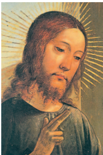
Rostre del Crist, del Tríptic de la Santa Cena. Sagristia de la catedral de Toledo.

Y, si tu pie te hace caer, córtatelo: más te vale entrar cojo en la vida, que ser echado con los dos pies al infierno. Y, si tu ojo te hace caer, sácatelo: más te vale entrar tuerto en el reino de Dios, que ser echado con los dos ojos al infierno, donde el gusano no muere y el fuego no se apaga.»