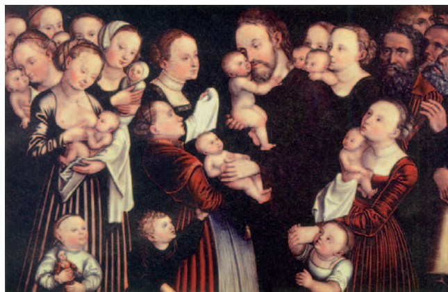
Jesús i els infants. Pintura de L. Cranach. Winterthur (Suïssa)

Que puguis veure els fills dels teus fills. / Pau a Israel! R.