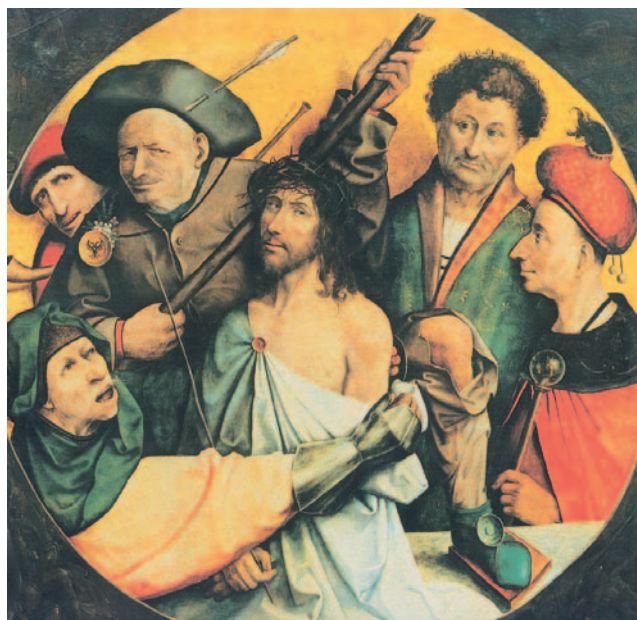
La coronació d'espines. Pintura de Jeroni Bosco, Museu de l'Escorial, Madrid.

Vosotros, nada de eso: el que quiera ser grande, sea vuestro servidor; y el que quiera ser primero, sea esclavo de todos. Porque el Hijo del hombre no ha venido para que le sirvan, sino para servir y dar su vida en rescate por todos.»