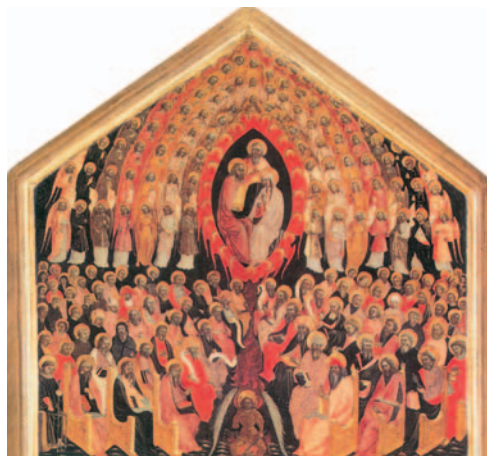
La comunió dels sants entorn de la Santíssima Trinitat. Pintura anònima del segle XIV, Museu Cívic de Bolònia

Ese recibirá la bendición del Señor, / le hará justicia el Dios de salvación. / Este es el grupo que busca al Señor, / que viene a tu presencia, Dios de Jacob. R.