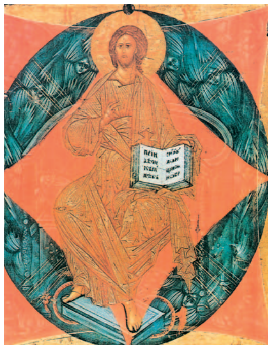
Crist, Salvador entre les Potències, Icona dels segles xv-xvi, Novgorod, Rússia

El día y la hora nadie lo sabe, ni los ángeles del cielo ni el Hijo, sólo el Padre.»