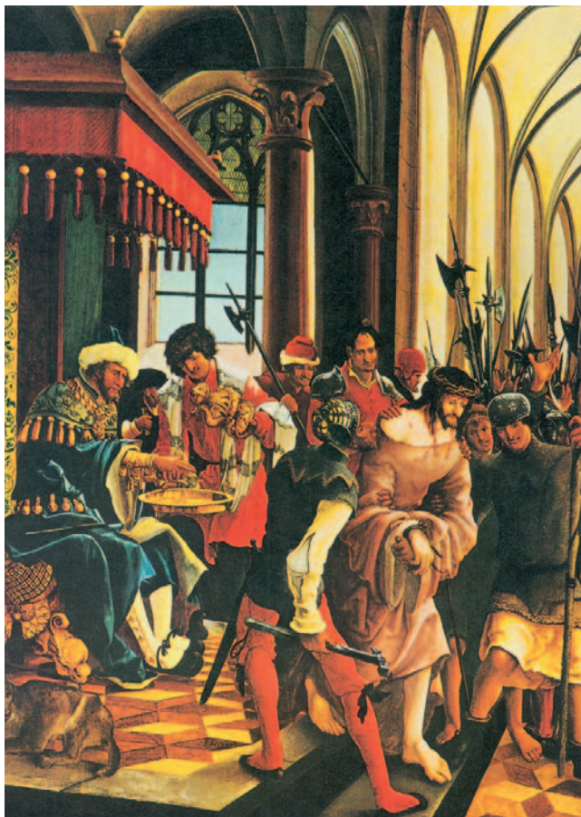
Crist davant Pilat, Pintura de Hieronymus Bosch, Museu Estatal d'Art, Frankfurt

A él la gloria y el poder por los siglos de los siglos. Amén. Mirad: Él viene en las nubes. Todo ojo lo verá; también los que lo atravesaron. Todos los pueblos de la tierra se lamentarán por su causa. Sí. Amén. Dice el Señor Dios: «Yo soy el Alfa y la Omega, el que es, el que era y el que viene, el Todopoderoso.»