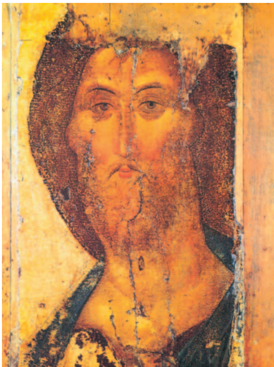
Rostre de Crist Salvador, icona d'Andrej Rublov (any 1400)

Cuando empiece a suceder esto, levantaos, alzad la cabeza: se acerca vuestra liberación. Tened cuidado: no se os embote la mente con el vicio, la bebida y los agobios de la vida, y se os eche encima de repente aquel día; porque caerá como un lazo sobre todos los habitantes de la tierra. Estad siempre despiertos, pidiendo fuerza para escapar de todo lo que esta por venir y manteneos en pie ante el Hijo del hombre.»