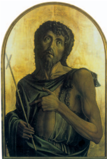
Sant Joan Baptista, pintura l'Alvise Vivarini (1445-1505). Museu Thyssen-Bornemisza, Madrid

Y recorrió toda la comarca del Jordán, predicando un bautismo de conversión para perdón de los pecados, como está escrito en el libro de los oráculos del profeta Isaías: «Una voz grita en el desierto: Preparad el camino del Señor, allanad sus senderos; elévense los valles, desciendan los montes y colinas; que lo torcido se enderece, lo escabroso se iguale. Y todos verán la salvación de Dios.»