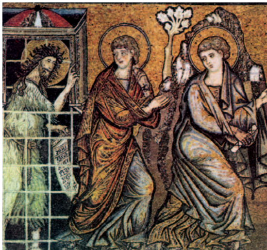
Joan Baptista, des de la presó, envia els seus deixebles a veure els signes que fa Jesús. Mosaic del baptisteri de la catedral de Florència (s. XII)

El pueblo estaba en expectación, y todos se preguntaban si no sería Juan el Mesías; él tomó la palabra y dijo a todos: «Yo os bautizo con agua; pero viene el que puede más que yo, y no merezco desatarle la correa de sus sandalias. Él os bautizará con Espíritu Santo y fuego; tiene en la mano el bieldo para aventar su parva y reunir su trigo en el granero y quemar la paja en una hoguera que no se apaga». Añadiendo otras muchas cosas, exhortaba al pueblo y le anunciaba el Evangelio.