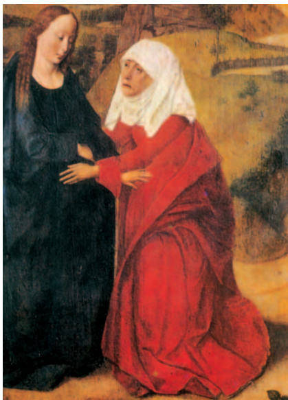
La Visitació de Maria a Elisabet, pintura de Thierry Bouts, Museu del Prado, Madrid

Se llenó Isabel del Espíritu Santo y dijo a voz en grito: «¡Bendita tú entre las mujeres, y bendito el fruto de tu vientre! ¿Quién soy yo para que me visite la madre de mi Señor? En cuanto tu saludo llegó a mis oídos, la criatura saltó de alegría en mi vientre. Dichosa tú, que has creído, porque lo que te ha dicho el Señor se cumplirá.»