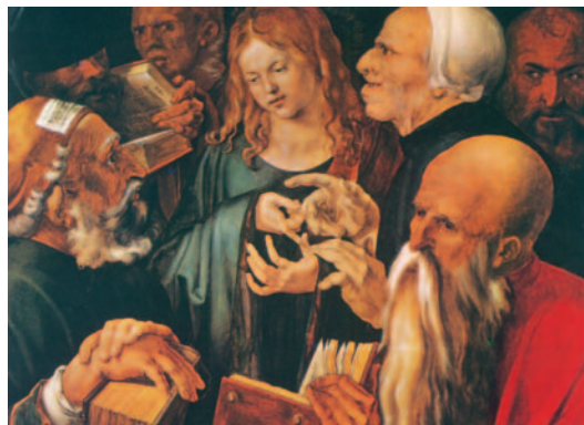
Jesús entre els mestres de la Llei. Pintura d'Albert Dürero, Col·lecció Thyssen, Lugano (Suïssa)

También se pueden leer las lecturas: 1Sa 1,20-22.24-28, Salm 83, 1Jn 3,1-2.21-24.