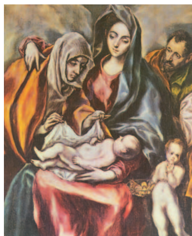
La Santa Família amb santa Anna i sant Joan Baptista infant, pintura del Greco, Museu del Prado, Madrid

La Palabra era la luz verdadera, que alumbra a todo hombre. Al mundo vino, y en el mundo estaba; el mundo se hizo por medio de ella, y el mundo no la conoció. Vino a su casa, y los suyos no la recibieron. Pero a cuantos la recibieron, les da poder para ser hijos de Dios, si creen en su nombre. Éstos no han nacido de sangre, ni de amor carnal, ni de amor humano, sino de Dios. Y la Palabra se hizo carne y acampó entre nosotros, y hemos contemplado su gloria: gloria propia del Hijo único del Padre, lleno de gracia y de verdad.