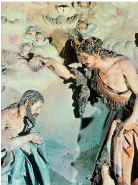
El baptisme de Crist, escultura de Gregorio Fernández (s. XVI-XVII), Museu Nacional d'Escultura, Valladolid

También se pueden leer las lecturas: Is 40,1-5.9-11, Salmo 103, Tt 2,11-14;3,4-7, Lc 3,15-16.21-22.