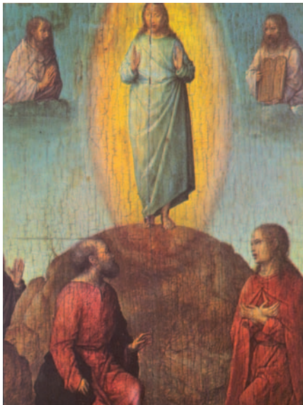
La Transfiguració, pintura de Juan de Flandes. Palau Reial, Madrid

Todavía estaba hablando, cuando llegó una nube que los cubrió. Se asustaron al entrar en la nube. Una voz desde la nube decía: «Éste es mi Hijo, el escogido, escuchadle.» Cuando sonó la voz, se encontró Jesús solo. Ellos guardaron silencio y, por el momento, no contaron a nadie nada de lo que habían visto.