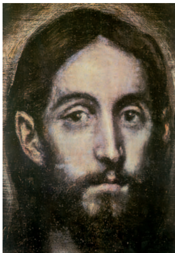
Crist, el Salvador. Fragment d'una pintura del Greco. Museu del Prado, Madrid

Y les dijo esta paràbola: «Uno tenía una higuera plantada en su viña, y fue a buscar fruto en ella, y no lo encontró. Dijo entonces al viñador: "Ya ves: tres años llevo viniendo a buscar fruto en esta higuera, y no lo encuentro. Córta-la. ¿Para qué va a ocupar terreno en balde?" Pero el viñador contestó: "Señor, déjala todavía este año; yo cavaré alrededor y le echaré estiércol, a ver si da fruto. Si no, la cortas."»