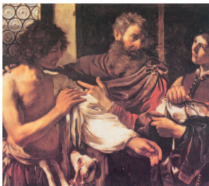
El fill pròdig, pintura de Guercino. Museu Borghese, Roma

Su hijo mayor estaba en el campo. Cuando al volver se acercaba a la casa, oyó la música y el baile, y llamando a uno de los mozos le preguntó qué pasaba. Éste le contestó: "Ha vuelto tu hermano; y tu padre ha matado el ternero cebado, porque lo ha recobrado con salud." Él se indignó y se negaba a entrar; pero su padre salió e intentaba persuadirlo. Y él replicó a su padre: "Mira: en tantos años como te sirvo, sin desobedecer nunca una orden tuya, a mí nunca me has dado un cabrito para tener un banquete con mis amigos; y cuando ha venido ese hijo tuyo que se ha comido tus bienes con malas mujeres, le matas el ternero cebado." El padre le dijo: "Hijo, tú siempre estás conmigo, y todo lo mío es tuyo: deberías alegrarte, porque este hermano tuyo estaba muerto y ha revivido; estaba perdido, y lo hemos encontrado".»