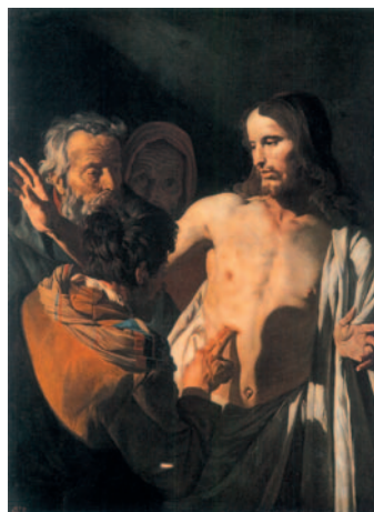
La incredulitat de sant Tomàs. Pintura de Mathias Stomer (1600-1650)

Muchos otros signos, que no están escritos en este libro, hizo Jesús a la vista de los discípulos. Estos se han escrito para que creáis que Jesús es el Mesías, el Hijo de Dios, y para que, creyendo, tengáis vida en su nombre.