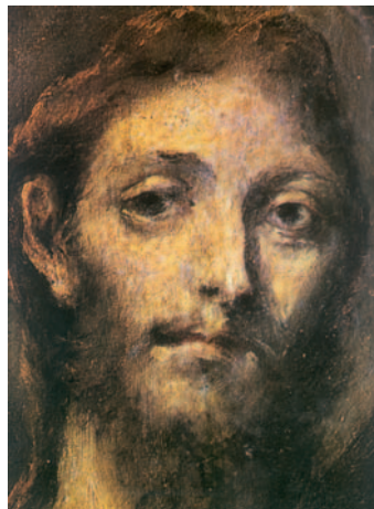
Faç del Crist ressuscitat. Pintura del Greco. Museu del Prado. Madrid

Al saltar a tierra, ven unas brasas con un pescado puesto encima y pan. Jesús les dice: «Traed de los peces que acabáis de coger.» Simón Pedro subió a la barca y arrastró hasta la orilla la red repleta de peces grandes: ciento cincuenta y tres. Y aunque eran tantos, no se rompió la red. Jesús les dice: «Vamos, almorzad.» Ninguno de los discípulos se atrevía a preguntarle quién era, porque sabían bien que era el Señor. Jesús se acerca, toma el pan y se lo da, y lo mismo el pescado. Esta fue la tercera vez que Jesús se apareció a los discípulos, después de resucitar de entre los muertos.