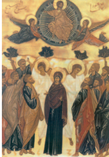
L'Ascensió, icona contemporània, Religioses de l'Anunciació, Natzare

Dicho esto, lo vieron levantarse, hasta que una nube se lo quitó de la vista. Mientras miraban fijos al cielo, viéndolo irse, se les presentaron dos hombres vestidos de blanco, que les dijeron: «Galileos, ¿qué hacéis ahí plantados mirando al cielo? El mismo Jesús que os ha dejado para subir al cielo volverá como le habéis visto marcharse.»