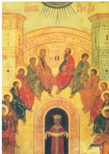
La vinguda de l'Esperit Sant, icona oriental

Glòria al Senyor per sempre. / Que s'alegri el Senyor contemplant el que ha fet, / que li sigui agradable aquest poema, / són per al Senyor aquests cants de goig. R.