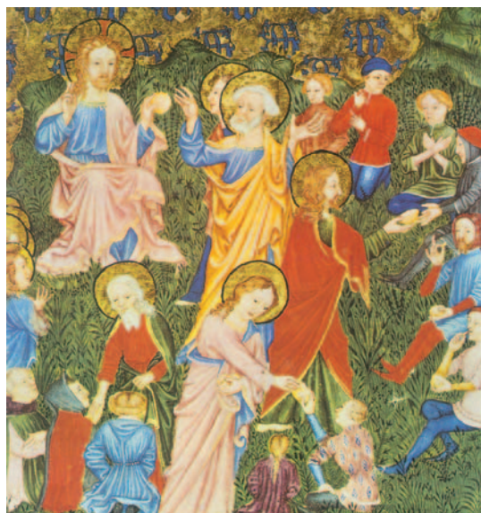
La multiplicació dels pans (del Breviari i Missals Franciscans, any 1380, Biblioteca Nacional de França)

Jesús dijo a sus discípulos: «Decidles que se echen en grupos de unos cincuenta.» Lo hicieron así, y todos se echaron. Él, tomando los cinco panes y los dos peces, alzó la mirada al cielo, pronunció la bendición sobre ellos, los partió y se los dio a los discípulos para que se los sirvieran a la gente. Comieron todos y se saciaron, y cogieron las sobras: doce cestos.