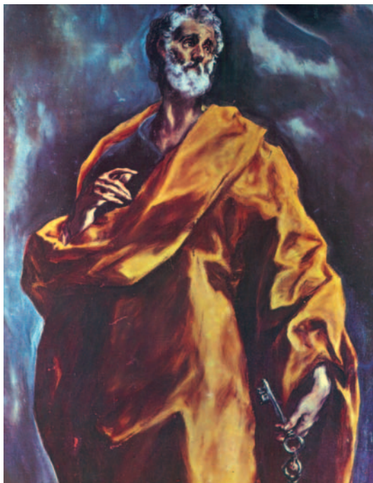
Sant Pere, pintura d'El Greco, Monestir de l'Escorial, Madrid

Y, dirigiéndose a todos, dijo: «El que quiera seguirme, que se niegue a sí mismo, cargue con su cruz cada día y se venga conmigo. Pues el que quiera salvar su vida, la perderá; pero el que pierda su vida por mi causa, la salvará.»