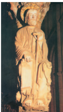
Imatge de sant Jaume, que des del famós Pórtic de la Glòria acull els pelegrins a Santiago de Compostel·la

Pero Jesús, reuniéndolos, les dijo: «Sabéis que los jefes de los pueblos los tiranizan y que los grandes los oprimen. No será así entre vosotros: el que quiera ser grande entre vosotros, que sea vuestro servidor, y el que quiera ser primero entre vosotros, que sea vuestro esclavo. Igual que el Hijo del hombre no ha venido para que le sirvan, sino para servir y dar su vida en rescate por muchos.»